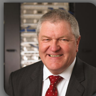
Ce livre blanc a été produit par Paul Cave, Directeur technique, pour le compte d'Excel.